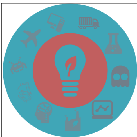
Figura 1- Logo do evento.

Os Quadros e Figuras, assim como as legendas de Quadros e Figuras devem estar centralizadas se conterem apenas em uma linha (Figura 1), caso contrário devem estar tabuladas em 0.8cm em ambas as margens, como é apresentada na Figura 2 . As legendas devem ser escritas na fonte “Times”, Tamanho 10pts, negrito. A identificação deve aparecer antes, precedida da palavra Figura, seguida de seu número de ordem de ocorrência no texto e do respectivo título de forma breve e clara, dispensando consulta ao texto, com espaço de 6pts antes. A fonte fica na parte inferior da Figura, com espaço de 6pts depois. Sempre que possível, procure colocar uma borda na figura (Figura 1 e Figura 2).